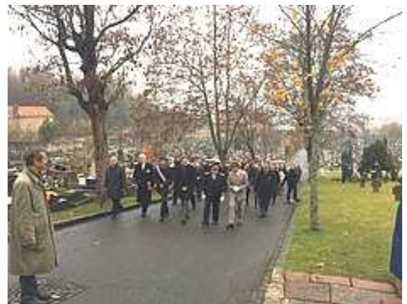
Cimetière des Gonards

A Versailles, la cérémonie centrale de commémoration de l'ambassade d'Allemagne s'est déroulée le dimanche 13 novembre au cimetière des Gonards sous la présidence de l'ambassadeur d'Allemagne en France, Nikolaus Meyer-Landrut. Etaient également présents Serge Morvan préfet des Yvelines, François de Mazières député-maire de Versailles, le général de corps d'armée Francis Autran, commandant d'armes de Versailles. Des élèves du lycée franco-allemand de Buc et de l'école internationale allemande de Paris ont également assisté à cette cérémonie qui a été suivie d'une réception à l'Hôtel de Ville où l'ambassadeur d'Allemagne a pu découvrir l'exposition consacrée au centième anniversaire de la bataille de la Somme et au rôle des aumôniers militaires pendant la guerre.