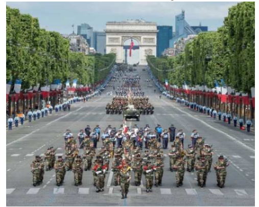
14 juillet 2016 – Le 24 e RI défile

La troisième compagnie a vu le jour à l'été 2015 et est stationnée à Versailles. Les réservistes opérationnels qui la composent résultent d'un processus d'engagement volontaire dont nous vous avons fait la description lors de notre numéro du mois de septembre.