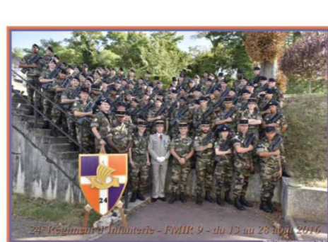
Août 2016 Formation initiale du réserviste